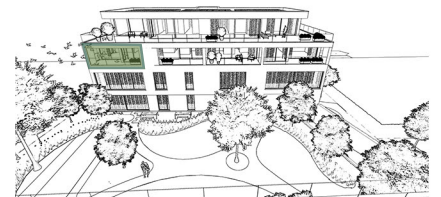
Achteraanzicht Gebouw A