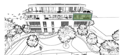
Achteraanzicht Gebouw A