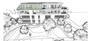
Achteraanzicht Gebouw A