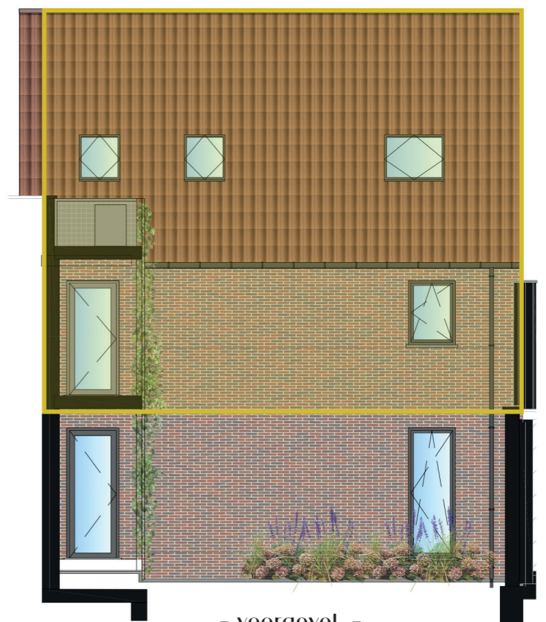
- voorgevel -