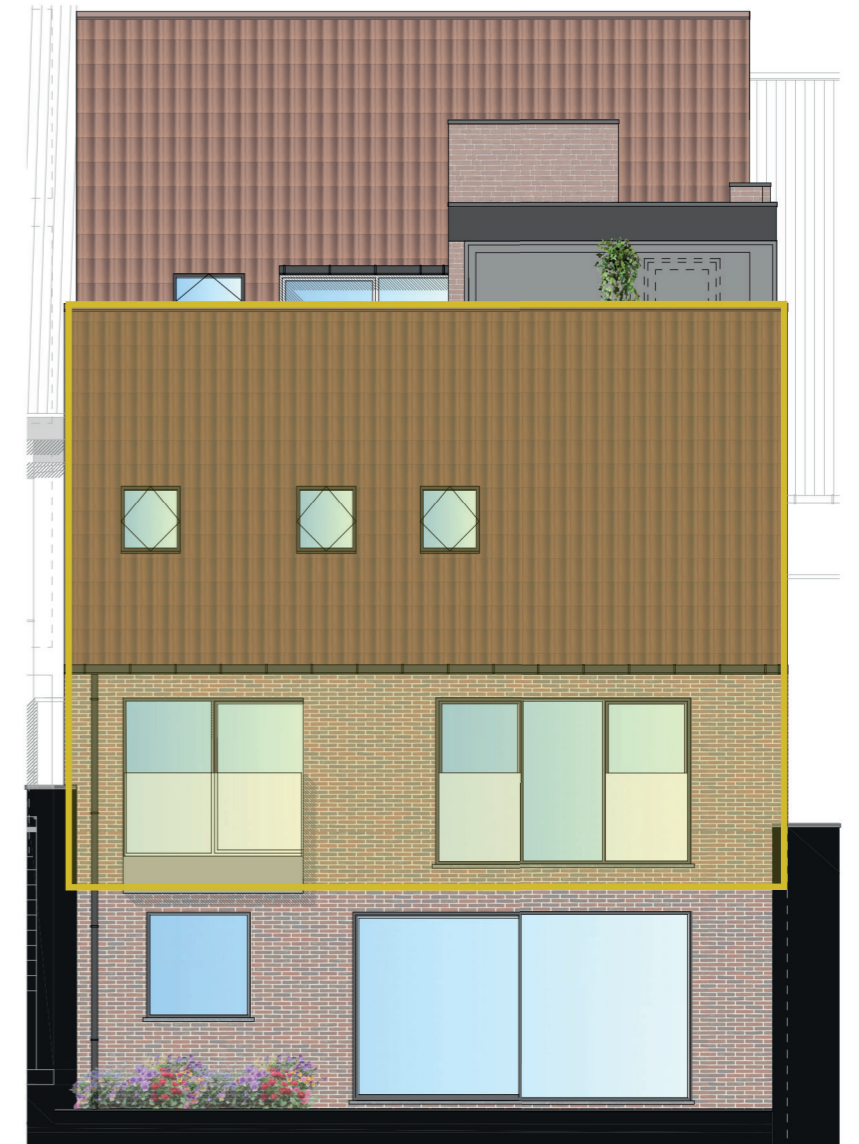
- achtergevel -