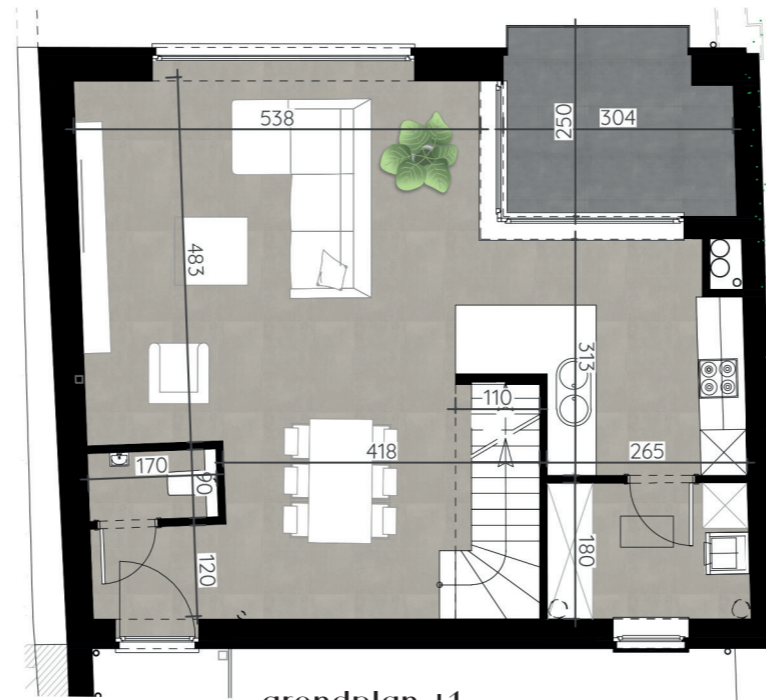
- grondplan +1 -