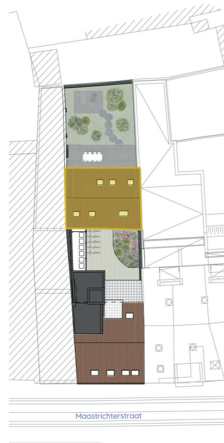
- inplanting 1/500 -