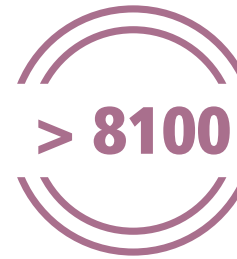
Leerlingen in Sint-Truiden