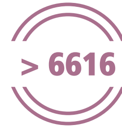
inwoners van generatie Z (15-29 jaar)