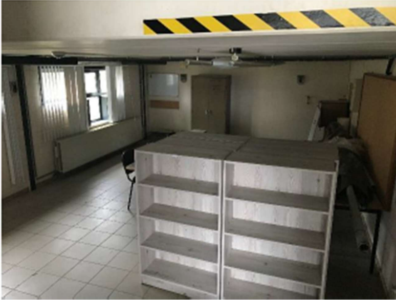
Figuur 6 - foto werkruimte - gelijkvloers

Ter beschikking te stellen onder de navolgende modaliteiten :