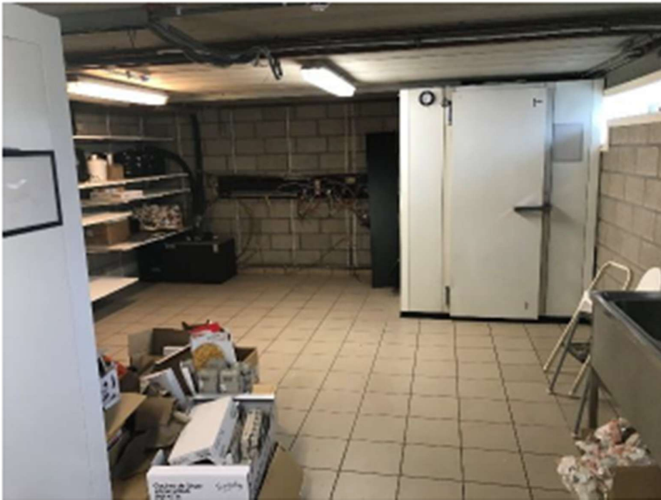
Figuur 4 – foto koelruimte - gelijkvloers

De verplicht ter beschikking te stellen koelruimte met koelcel en diepvriezer bevindt zich op de site Breugelhoeve in het horeca gedeelte, op het gelijkvloers.