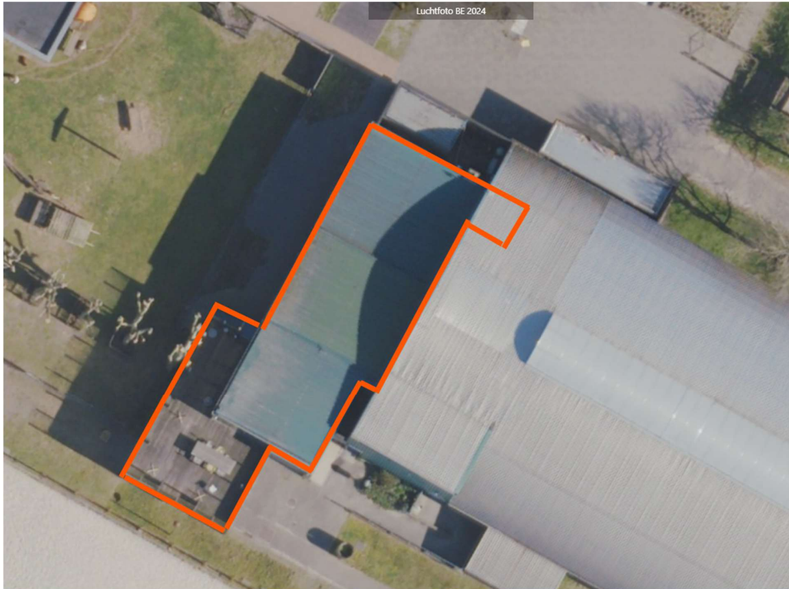
Figuur 2 – Ter beschikking te stellen verbruiksruimte met keuken, buitenterras en koelruimte site Breugelhoeve - bovenaanzicht

3.6.2.2. Verplichte terbeschikkingstelling van een verbruiksruimte voor 70 personen met keuken om maaltijden te kunnen bereiden, met buitenterras en een koelruimte met koelcel en diepvriezer, op de site Breugelhoeve (voorkeur) of binnen een straal van 400m van de verblijfsaccommodatie site Breugelhoeve (niet noodzakelijk met buitenterras), aan stad Peer