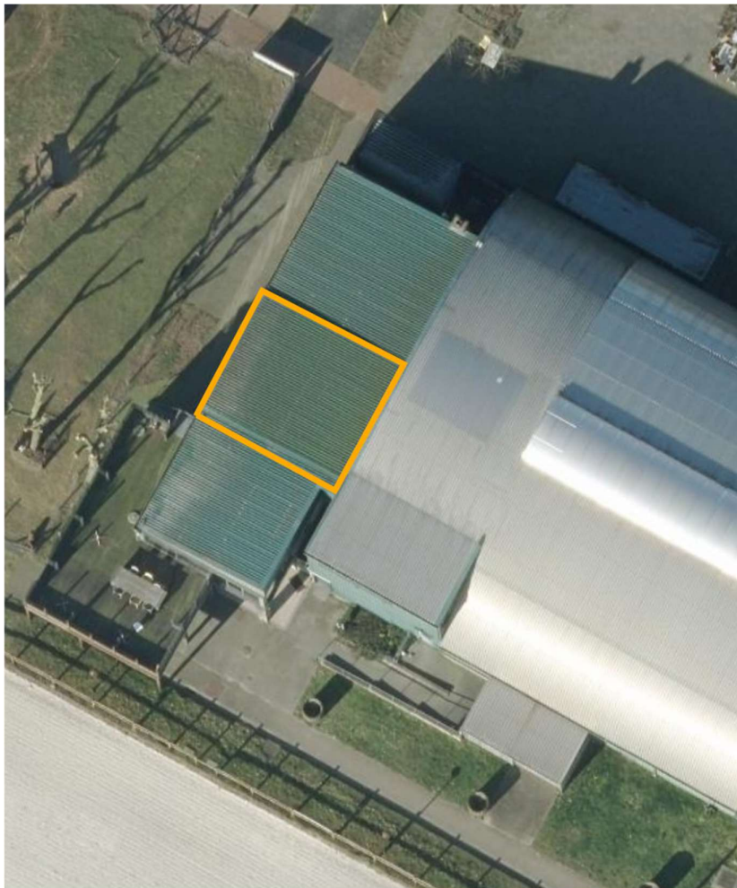
Figuur 5 - Ter beschikking te stellen werkruimte site Breugelhoeve - bovenaanzicht

3.6.2.3. Verplichte terbeschikkingstelling van een werkruimte met een oppervlakte van ongeveer 50m 2 , op site Breugelhoeve (voorkeur) of binnen een straal van 200m van de verblijfsaccommodatie op de site Breugelhoeve.