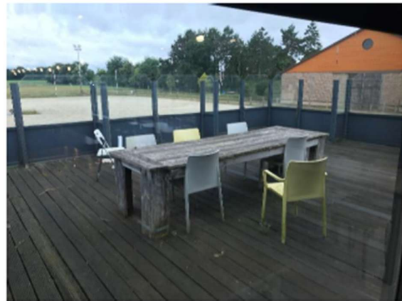
Figuur 3 - foto's verbruiksruimte, keuken en buitenterras – 1 ste verdieping